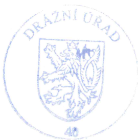
Ing. František Kuška ředitel územního odboru Plzeň

Proti tomuto rozhodnutí může účastník řízení podat odvolání podle §81 odst. 1. zákona č. 500/2004 Sb., správní řád, ve znění pozdějších předpisů (dále jen "správní řád"), ve lhůtě 15 dnů ode dne jeho oznámení, k Ministerstvu dopravy, podáním učiněným u Drážního úřadu, sekce stavební, územní odbor Plzeň, Škroupova 11, 301 36 Plzeň. Odvolání jen proti odůvodnění rozhodnutí je podle ustanovení §82 odst. 1 správního řádu nepřípustné . Odvolání se podává s potřebným počtem vyhotovení tak, aby jeden stejnopis zůstal správnímu orgánu, a aby každý účastník dostal jeden stejnopis. Nepodá-li účastník potřebný počet stejnopisů, vyhotoví je Drážní úřad na náklady účastníka.